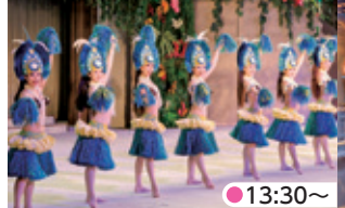
ポリネシアン・サンライトカーニバル ●13:30~ 陽光を浴びながら陽気に舞い踊る昼のショー。