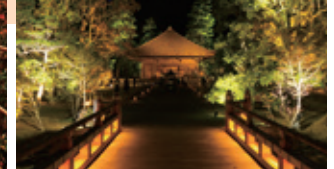
国宝・白水阿弥陀堂