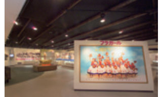
フラミュージアム ハイアンスやフラの歴史を展示している資料館。