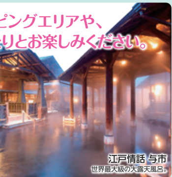
江戸情話 与市 世界最大級の大露天風呂。