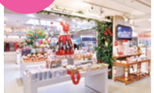
ハイアンスマーケット 多彩な商品が並び、施設内最大のマーケット。

ご宿泊翌日もスパ施設のご利用可能! 県内最大級のショッピングエリアや、多彩な一年中楽しめるプールや温泉施設をご出発までゆったりとお楽しみください。