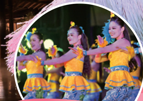
ポリネシアン・グランドステージ [20:30~ 毎日開催]