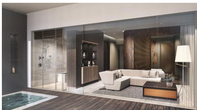
クラブフロア客室