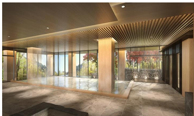
露天風呂付き大浴場①

豊富な湯量を最大限に生かした、趣の異なる 2 つの露天風呂付き大浴場をご用意いたします。一方はドライサウナ、もう一方はスチームサウナを完備。時間による男女入れ替え制により、滞在中に趣向、サウナの種類の違いをお楽しみいただけます。