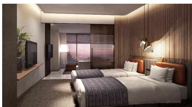
クラブフロア寝室