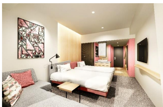
スーペリアフロア客室

（*1）自動ポーターはチェックイン時、お荷物をご宿泊フロアの専用ロッカーまでお届け、自動クロックはチェックアウト後のお荷物を自動倉庫でお預かりするサービスです。