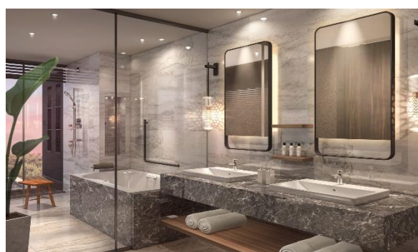
クラブフロア浴室