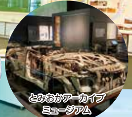
とみおかアーカイブミュージアム