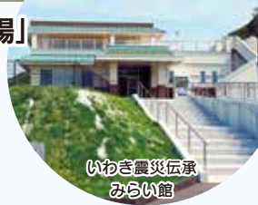
いわき震災伝承みらい館