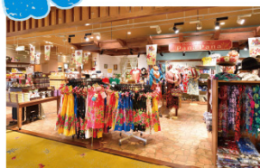
ハワイアンズマーケット 多彩な商品が並び、施設内最大のマーケット。

ご宿泊翌日もスパ施設のご利用可能! 県内最大級のショッピングエリアや、多彩な一年中楽しめるプールや温泉施設をご出発までゆったりとお楽しみください。