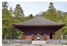
国宝・白水阿弥陀堂