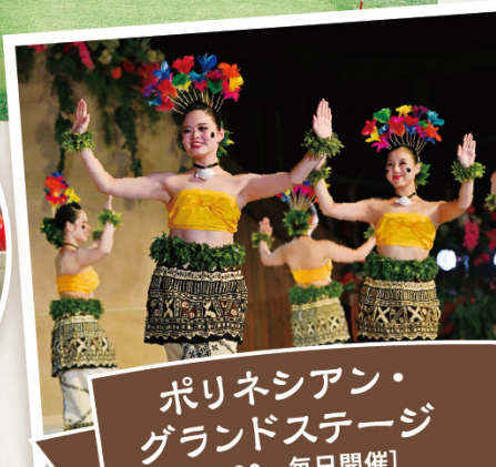
ポリネシアン・ グランドステージ [20:30～毎日開催]