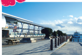
いわき・ら・ら・ミュウ