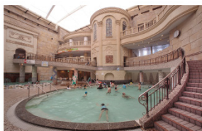
スプリングパーク 水着でも裸でも楽しめる「温泉パラダイス」