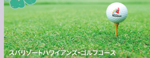
スパリゾートハワイアンズ・ゴルフコース