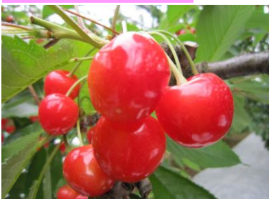
さくらんぼ狩り(30分間食べ放題)