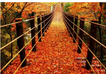
花貫溪谷 汐見滝「吊り橋」⇄駐車場 約1.5km・徒歩約20分