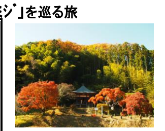
国指定天然記念物

JR湯本駅(7:50)⇒ハワイアンズ(8:30)⇒ 「龍神峡」(散策)⇒ いわき湯本柏屋(買物 日本三大饅頭)⇒ 中釜戸のシダレモミジ(見学)⇒ 昼食(小名浜)⇒ JR湯本駅(14:15)⇒ハワイアンズ(14:30)