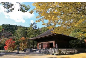
国宝「白水阿弥陀堂」