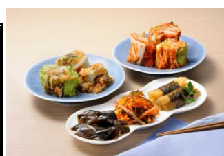
西野屋食品(買物 漬物)

ハワイアンズ(8:50)⇒JR湯本駅(9:00)⇒ 国宝・白水阿弥陀堂(参拝)⇒ いわき湯本柏屋(買物 日本三大饅頭)⇒ 西野屋食品(買物 漬物)⇒ 昼食(小名浜)⇒ JR湯本駅(14:15)⇒ハワイアンズ(14:30)