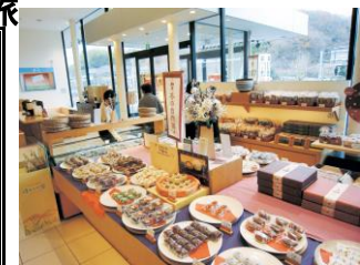
いわき湯本柏屋 日本三大饅頭

JR湯本駅(7:20)⇒ハワイアンズ(8:00)⇒ 高萩市・花貫溪谷(散策)⇒ 庭園味噌蔵・たつご味噌(買物)⇒ いわき湯本柏屋(買物 日本三大饅頭)⇒ 昼食(小名浜)⇒ JR湯本駅(14:15)⇒ハワイアンズ(14:30)